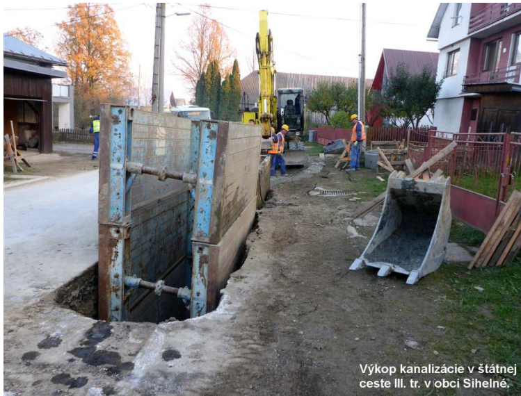
Výkop kanalizácie v štátnej ceste III. tr. v obci Sihelné.

Ukončená kanalizácia a konečná úprava miestnej komunikácie. Nový asfaltový koberec na celú šírku cesty v obci Zákamenné.