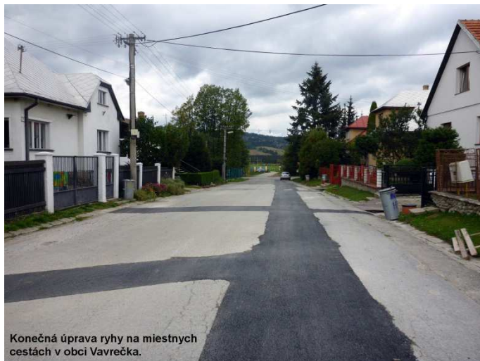
Konečná úprava ryhy na miestnych cestách v obci Vavrečka.