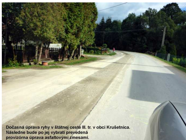
Dočasná úprava ryhy v štátnej ceste III. tr. v obci Krušetnica. Následne bude po jej vybratí prevedená provizórna úprava asfaltovými zmesami.

o nenávratný finančný príspevok a dňa 14. 11. 2012 Európska komisia schválila veľký projekt odkanalizovania regiónu Oravy „Zásobovanie vodou a kanalizácia oravského regiónu, etapa 2.“ Ide o projekt financovaný z Operačného programu Životné prostredie (OPŽP) pod Ministerstvom životného prostredia. Realizáciou projektu bude na novú kanalizačnú sieť napojených 18 801 obyvateľov zo 7 obcí Vavrečka, Hruštín, Zákamenné, Novoť, Rabča, Oravská Polhora a Sihelné . Odpadové vody od týchto producentov budú čistené na už vybudovanej ČOV Námestovo, ktorá bola vybudovaná v rámci prvej etapy projektu aj pre producentov etapy II. a ostatných obcí okresu Námestovo. V rámci projektu sa vybuduje 127,207 km gravitačnej kanalizácie, 15 ks čerpacích staníc odpadových vôd a 9,093 km výtlačného kanalizačného potrubia. Zároveň sa zrekonštruujú existujúce čistiarne odpadových vôd v Dolnom Kubíne (23 000 EO) ktorá slúži pre čistenie odpadových vôd mesta Dolný Kubín a príslušných obcí a ČOV v Nižnej n. Oravou (26 000 EO) ktorá slúži pre čistenie odpadových vôd mesta Trstená a príslušných obcí.