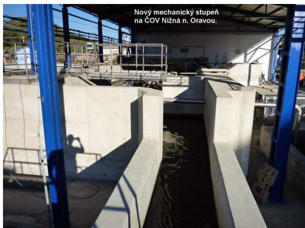
Nový mechanický stupeň na ČOV Nižná n. Oravou.