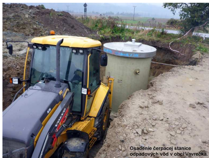
Osadenie čerpacej stanice odpadových vôd v obci Vavrečka.