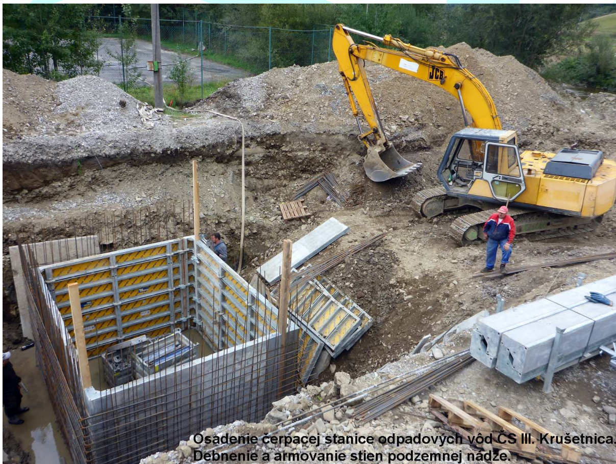
Osadenie čerpacej stanice odpadových vôd ČS III. Krušetnica. Debnenie a armovanie stien podzemnej nádze.

Na stavbe pracujú 8 stavební dozori. 1x vedúci stavebných dozorov, 5x stavebný dozor pre kanalizáciu, 2x stavebný dozor pre ČOV Dolný Kubín a ČOV Nižná. K dátumu 11/2015 bola predložená faktúra č. 8 za obdobie 07 – 09/2015. V danom období sa využívali aj služby špecialistov, 1x elektrotechnický inžinier, 1x geodet stavby, 1x strojnotechnologický inžinier a 1x rozpočtár. Stavebný dozor predložil k 09/2015 faktúry č. 1 až č. 8 vo výške 1 600 980,0 € čo predstavovalo finančnú prestavanosť 86,8 %.