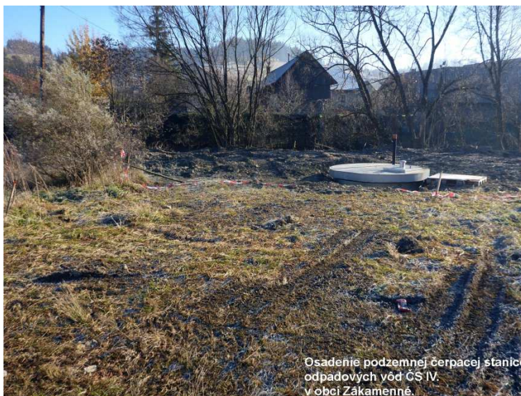
Osadenie podzemnej čerpacej stanice odpadových vôd ČS IV. v obci Zákamenné.