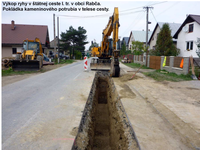
Výkop ryhy v štátnej ceste I. tr. v obci Rabča. Pokládka kameninového potrubia v telese cesty.