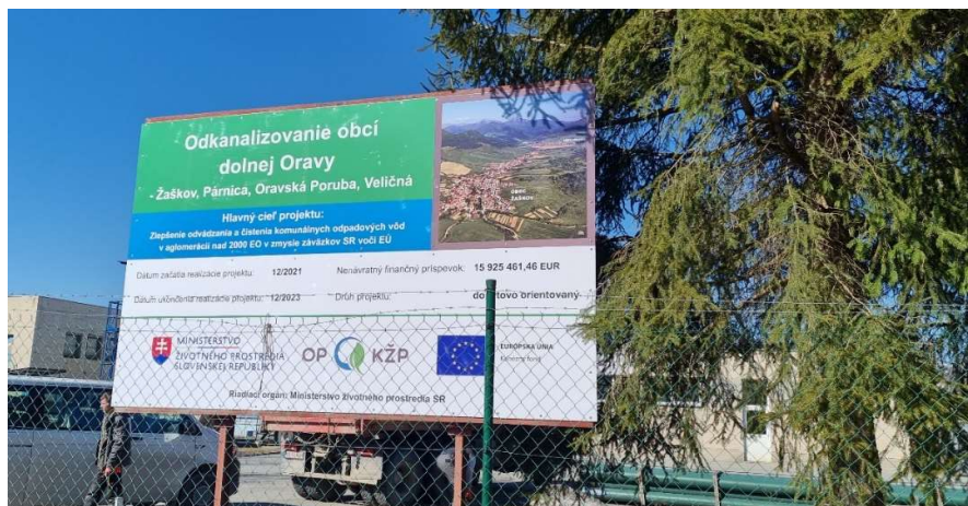
Obr. 2: Billboard – osadený pri ČOV Dolný Kubín

V týchto dňoch už prebiehali práce v teréne, ako vytýčenie stavby, vytýčenie inžinierskych sietí, zabezpečovanie materiálového a strojového vybavenia, osadenie dočasných pútačov a iné. V záujme zabezpečenie čo najlepšej informovanosti obyvateľstva v obciach, kde je budovaná verejná kanalizácia boli okrem dodaných plagátov, letákov a propagačných materiálov realizované aj verejné hovory a to dňa 02.03.2022 .