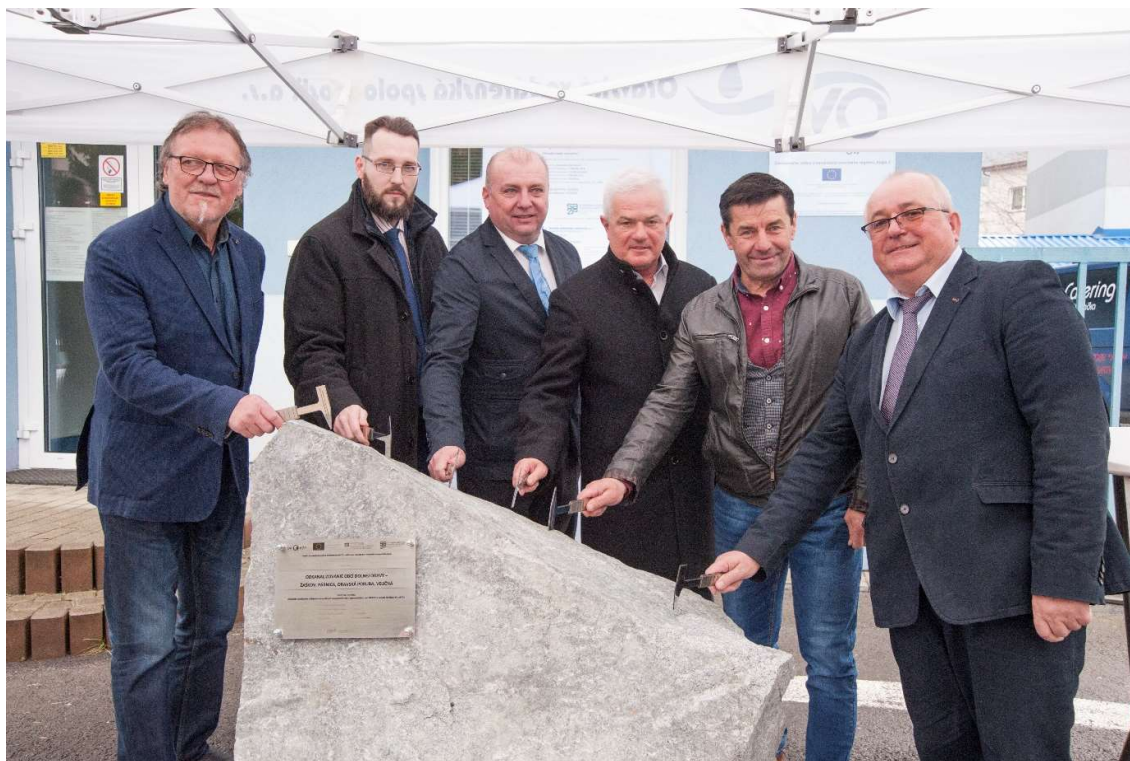
Obr.1: Slávnostné zahájenie stavby – poklepanie základného kameňa

Dňa 22.02.2022 OVS, a.s. - Objednávateľ stavebných prác oficiálne odovzdal Stavenisko Zhotoviteľovi – združeniu „ORAVA VSCVH“ a dňa 31.03.2022 bola stavba slávnostne zahájená.