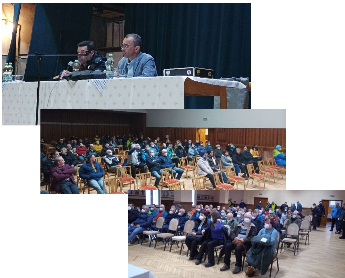
Obr.3: Verejný hovor v obci Párnica a Žaškov