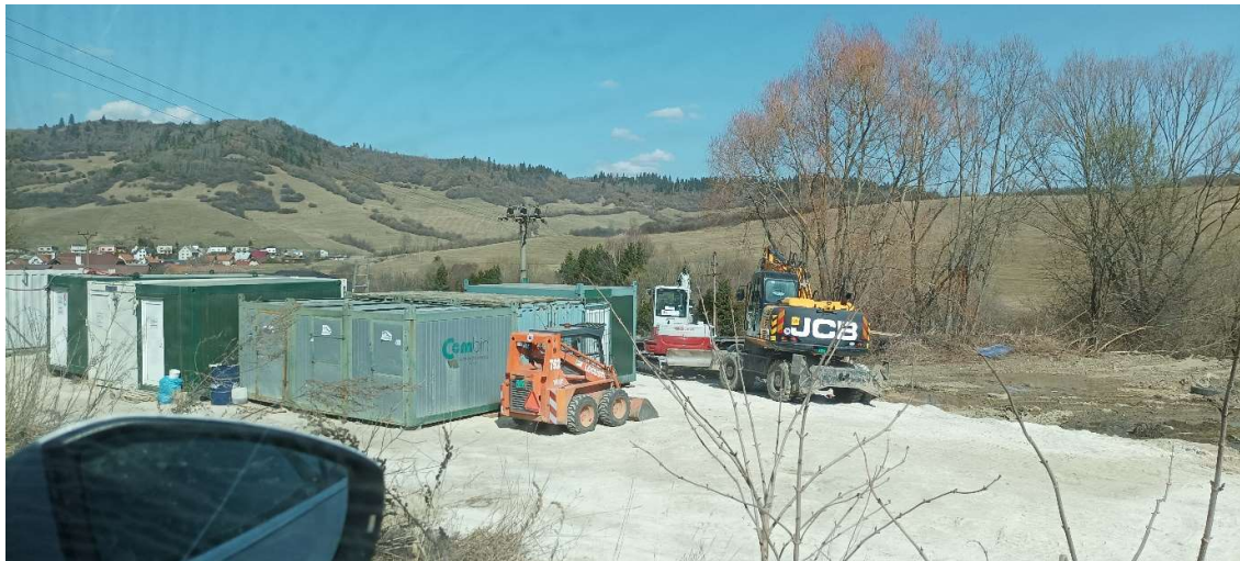
Obr.7: Zriadené stavenisko v obci Žaškov (SS.01)

Od 23.03.2022 sa pracuje aj na stavebnom objekte „ SS.01 Žaškov, kanalizácia “. Začalo sa frézovaním na uliciach Lackovská (stoka B10) a Roveň (stoka B12), pokračuje sa ulicami Reko vo (stoka B9), Kozlovská (stoka B11, B11-1) a Majdovská (stoka B12-1).