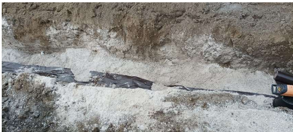
Obr.6: Položenie výtlačného potrubia V1 (SS.05)