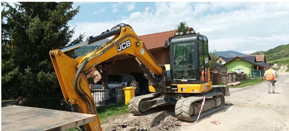
Obr.9: Hĺbenie ryhy pre polozenie kanalizačného potrubia v obci Párnica (SS.02)

Od začiatku apríla sa výkopové práce realizujú aj na stavebnom súbore SS.02 Párnica, kanalizácia . Realizovaná je aktuálne stoka C, C4, C4-1, B2-1, B2-3.