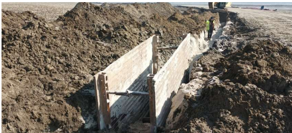
Obr.5: Výkop ryhy pre výtlačné potrubie V1 a jej zabezpečenie pažením (SS.05)