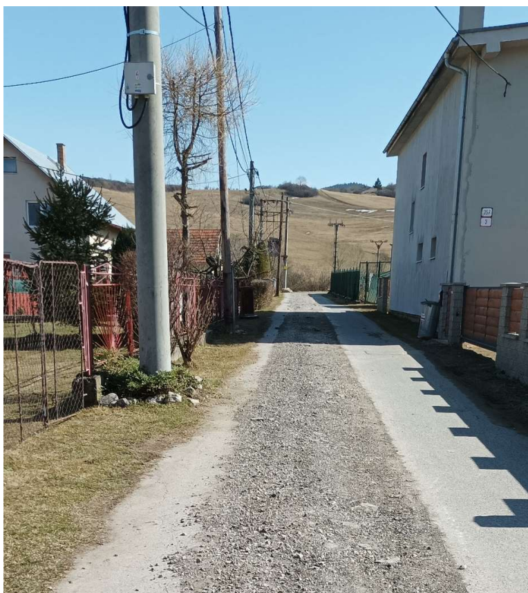
Obr.8: Frézovanie miestnej komunikácie v obci Žaškov (SS.01)