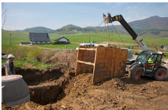
Obr. 3: Hĺbenie ryhy pre uloženie kanalizačného potrubia a osadenie potrebného pažiacej konštrukcie v obci Žaškov (SS.01)