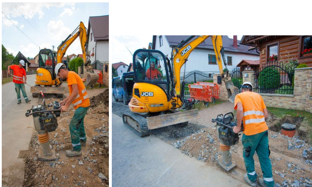
Obr. 1: Práce pri budovaní kanalizačných prípojok k rodinným domom v obci Žaškov (SS.01)

V sledovanom období bolo položených 2 777,3 m kanalizačného potrubia. Vybudované boli vetvy: A, B, B1, B9, B10, B11, B11-1, B12, B12-1. Budovaných bolo 94 ks kanalizačných prípojok kanalizačných prípojok k rodinným domom, čo predstavuje 419,67m.