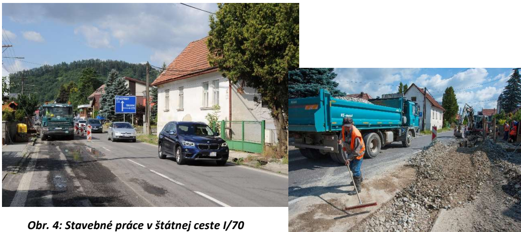
Obr. 4: Stavebné práce v štátnej ceste I/70 v obci Párnica (SS.02)

V závere sledovaného obdobia je položených 2 395,55 m kanalizačného potrubia z celkových 6 393,50 m (uvažované bez kanalizačných prípojok), čo predstavuje 37,4% kanalizačného potrubia v obci Párnica.