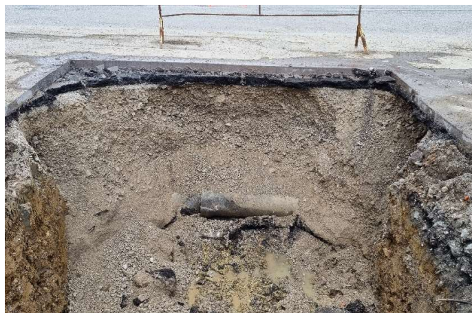
Obr. 6: Dažďové odvodnenie objavené počas realizácie technológie pretlaku kanalizačného potrubia, stoka „C“ v obci Párnica (SS.02)