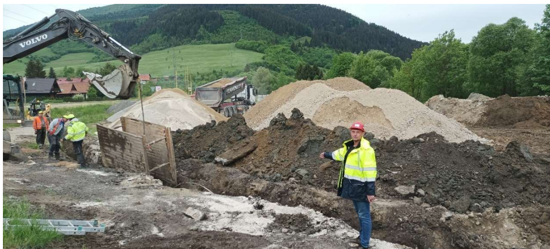
Obr. 8: Obhliadka staveniska pracovníkom OVS, a.s. v rámci zabezpečenia BOZP (SS.01)

V závere sledovaného obdobia je vybudovaných 37,2% dĺžky kanalizačného potrubia na diele „Odkanalizovanie obcí dolnej Oravy – Žaškov, Párnica, Oravská Poruba, Veličná“.