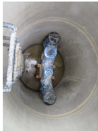
Obr. 7: Stavebné práce - kanalizačný zberač SS.05: polozenie výtlačného potrubia, osadená vzdušnikovú šachta, vybavenie vzdušnikovej šachty

Územím s vybudovaným úsekom kanalizačného zberača prebehla biologická rekultivácia, uvedenie do pôvodného stavu a vyčistenie škody, ktorá nastala jednotlivým užívateľom poľnohospodárskej pôdy.