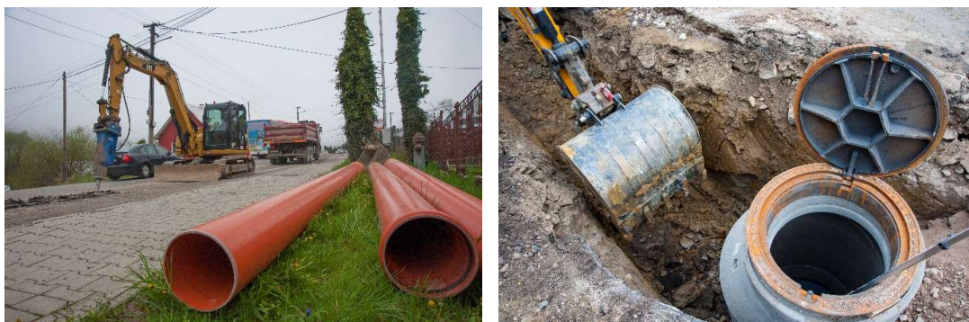
Obr. 5: Stavebné práce v štátnej ceste I/70 v obci Párnica (SS.02)

V závere sledovaného obdobia je položených 2 395,55 m kanalizačného potrubia z celkových 6 393,50 m (uvažované bez kanalizačných prípojok), čo predstavuje 37,4% kanalizačného potrubia v obci Párnica.