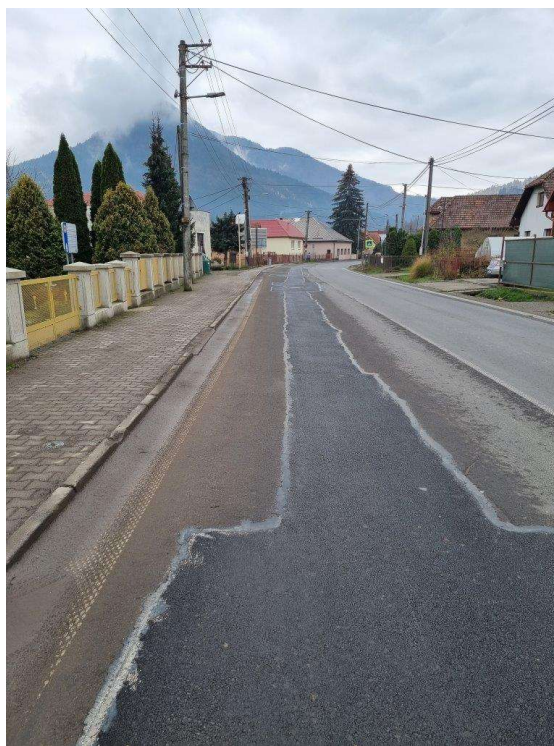
Obr. 6: Dočasná úprava štátnej cesty I/70 v obci Párnica (SS.02)

V závere sledovaného obdobia boli ukončené stavebné práce v štátnych cestách. Bola prevedená dočasná úprava asfaltovaním a príprava na zimnú údržbu.