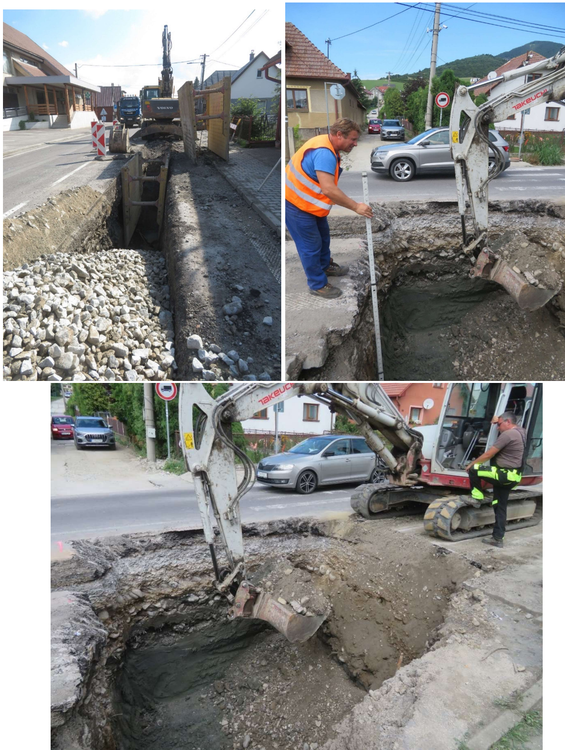
Obr. 4: Stavebné práce v štátnej ceste I/70 v obci Párnica (SS.02)

V závere sledovaného obdobia je položených 4 664m kanalizačného potrubia z celkových 7 757,5 m (uvažované bez kanalizačných prípojk), čo predstavuje 60,13% kanalizačného potrubia v obci Párnica.