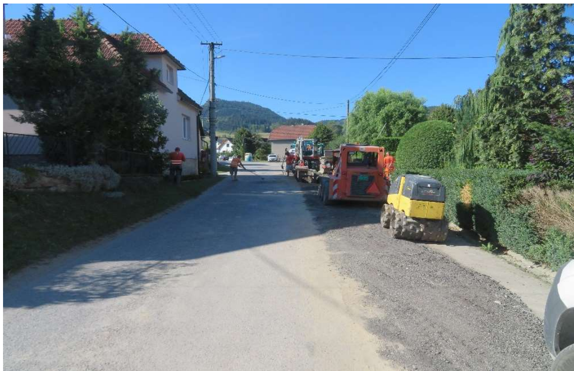
Obr. 1: Hutnenie ryhy v miestnej komunikácii v obci Žaškov (SS.01)

K dátumu 31.10.2022 je položených 6 085,54 m kanalizačného potrubia z celkových 10 746 m (uvažované bez kanalizačných prípojok), čo predstavuje 56,63% kanalizačného potrubia v obci Žaškov. V závere sledovaného obdobia boli ukončené stavebné práce v štátnych komunikáciách, bola prevedená dočasná úprava asfaltovaním a absolvovali sme obhliadku so správcom komunikácií pred zimnou údržbou.