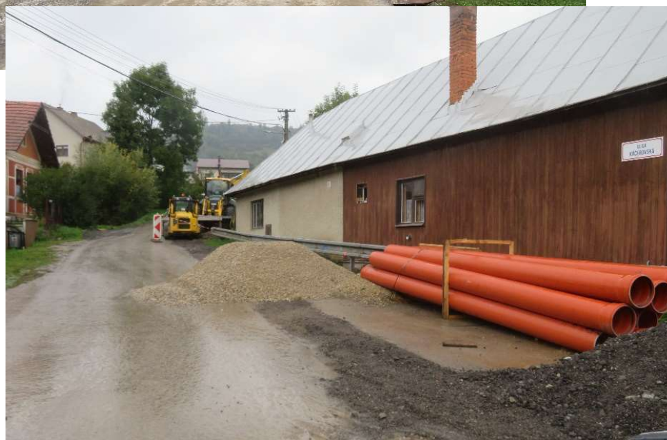
Obr. 3: Uloženie kanalizačného potrubia, zásyp a hutnenie v obci Žaškov (SS.01)