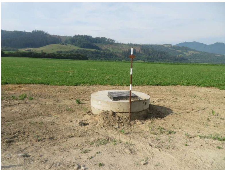
Obr. 7: Stavebné práce - kanalizačný zberač SS.05: osadená vzdušníková šachta

Územím s vybudovaným úsekom kanalizačného zberača prebehla biologická rekultivácia, uvedenie do pôvodného stavu a vyčistenie škody, ktorá nastala jednotlivým užívateľom poľnohospodárskej pôdy.