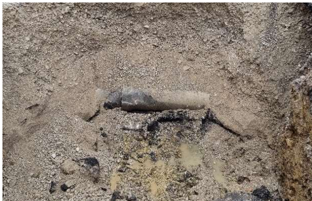
Obr. 5: Dažďové odvodnenie objavené počas realizácie technológie pretlaku kanalizačného potrubia, stoka „B6“ v obci Párnica (SS.02)

Súčasťou stavebných prác bola aj preložka dažďového odvodnenia v celkovej dĺžke 55,44 m , ktoré bolo odhalené pri trasovaní stoky B6. Preložených bolo aj 264,39 m verejného vodovodu, ktorý bol v kolízii s trasovanou kanalizáciou, stokou C4.