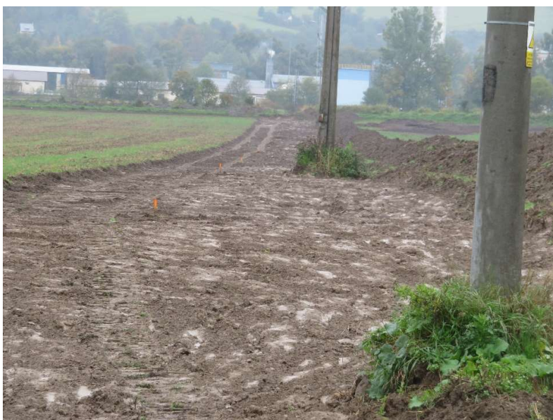
Obr. 8: Vytýčená trasa kanalizačného potrubia PP DN400, stoka A (SS.07) a stiahnutá ornica

Stavebné práce na stavebnom súbore začali prebiehať v mesiaci 10/2022 v smere od Dolného Kubína. Položených bolo 347,82 m kanalizačného potrubia, čo predstavuje 12,98%.