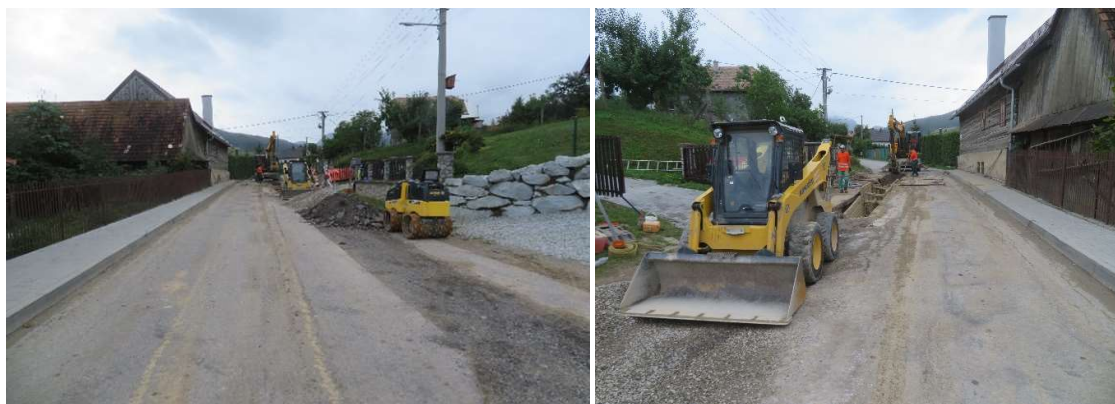
Obr. 2: Budovanie kanalizácie - stavebné práce v ceste III. triedy v obci Žaškov (SS.01)

Operatívne boli riešené aj zmeny v trasovaní budovanej kanalizácie v záujme vlastníckych práv občanov. Zvolané boli rokovania, kde sa hľadali schodné riešenia.