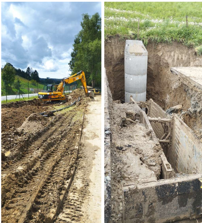
Obr.5: Obr. 3 Budovanie verejnej kanalizácie (SS.07)