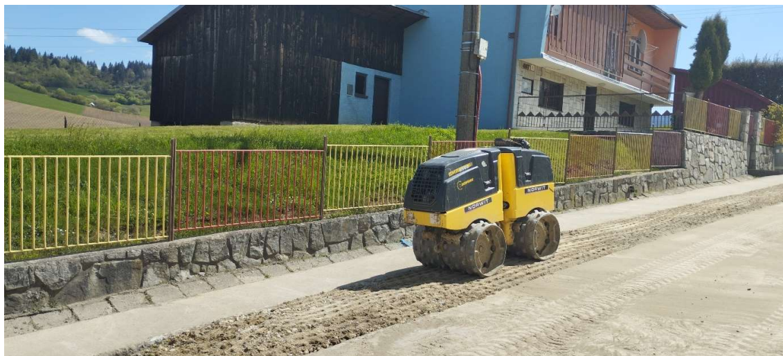
Obr. 2: Vibračné zhutňovanie zemin - spätný zásyp v obci Žaškov (SS.01)