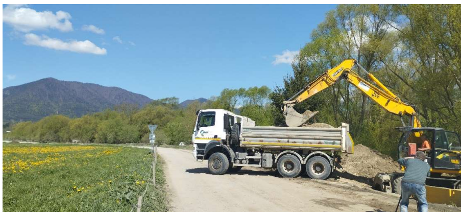
Obr.4.1: Osádzanie čerpacej stanice - ČS.02 v obci Oravská Poruba (SS.07)

V sledovanom období bolo položených 462,18m kanalizačného potrubia a zrealizovaná bola NN prípojka pre čerpaciu stanicu ČS.02.