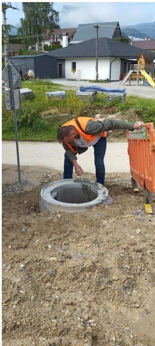
Obr. 6: Obhliadka staveniska pracovníkom OVS, a.s. v rámci zabezpečenia BOZP (SS.01 a SS.02)

V súčasnosti je položených 28,09 km z celkových 30,003 km . V závere sledovaného obdobia je vybudovaných 93,63% dĺžky kanalizačného potrubia na diele „Odkanalizovanie obcí dolnej Oravy – Žaškov, Párnica, Oravská Poruba, Veličná“.