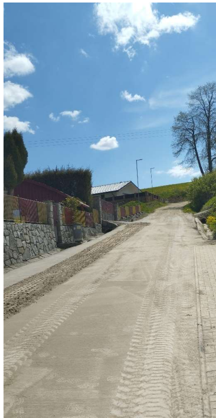
Obr. 1: Budovanie kanalizácie - stavebné práce v miestnej komunikácii v obci Žaškov (SS.01)