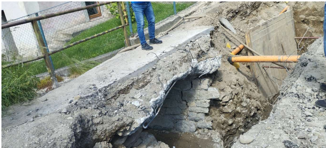
Obr. 3 Budovanie verejnej kanalizácie v obci Párnica (SS.02)

V závere sledovaného obdobia je položených 6 750,73m kanalizačného potrubia z celkových 7 757,5 m (uvažované bez kanalizačných prípojok), čo predstavuje 87,02% kanalizačného potrubia v obci Párnica. V sledovanom období bolo taktiež položených 348,07 m kanalizačného potrubia, ktoré bolo naprojektované dodatočne pre novovzniknuté lokality.